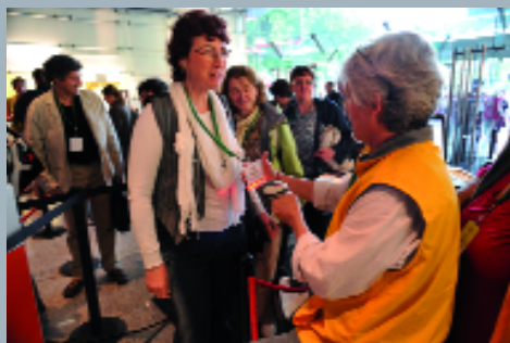
Modernité oblige, le contrôle des badges était réalisé grâce à un code-barres et avec le sourire.