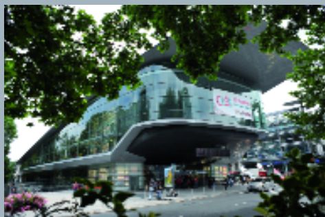
Le Palais des congrès de Tours a été conçu par l'architecte Jean Nouvel.

Les congressistes ont voté le quitus au Bureau national sur le rapport d'activité à une large majorité. Pour: 86,8%; contre: 13,2%.