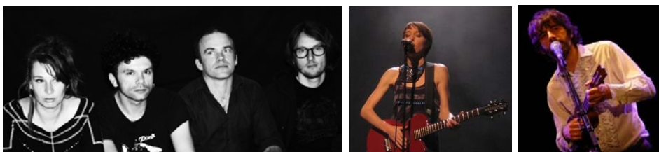
Eiffel, Jeanne Cherhal et Thomas Fersen